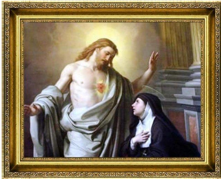
Première apparition de Jésus à Sainte Marguerite-Marie le 27 décembre 1673

« Voilà ce Cœur qui a tant aimé les hommes qu'il n'a rien épargné jusqu'à épuiser et se consumer pour leur témoigner son amour; et pour reconnaissance, je ne reçois de la plupart que des ingrattitudes, par leurs irrévérences et leurs sacrilèges, et par les froideurs et les mépris qu'ils ont pour moi dans ce Sacrement d'Amour»