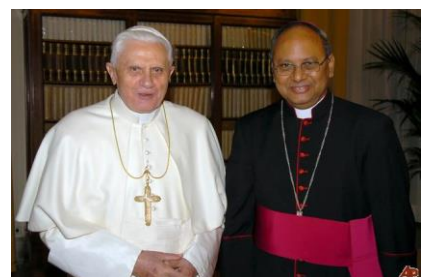
S E Mgr Ranjith aux côtés de Benoît XVI

Loin des polémiques stériles ce petit livre d'un évêque du Kazakhstan appelle à prendre de la hauteur et du recul sur cette question. À la fois témoignage et réflexion, il explique la pratique de communion réintroduite par Benoît XVI avec un véritable souci pédagogique et pastoral.